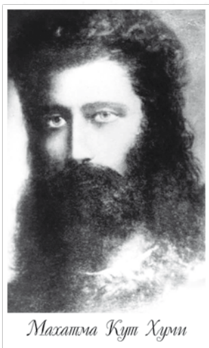
Махатма Кут Хурми

Esteemed Brother and Friend, Precisely because the rest of the London newspaper would close the columns of the sceptics — it is not better. See it is what light you will — the world